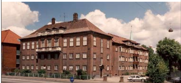
Norges hus, det norske hus i København.

Neste korrespondentbrev kjem frå Kambodsja.